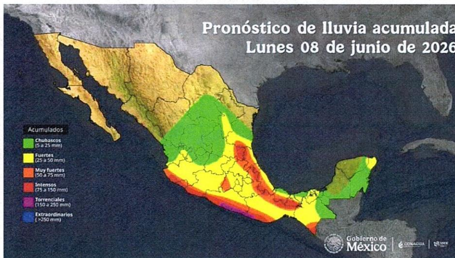
Figura 2. Pronóstico de lluvias del 08 de junio de 2026.